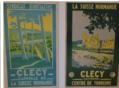
A. Hardy - Affiches - Coll. musée André Hardy

«Un matin, l'un de nous manquant de noir, se servit de bleu : l'impressionnisme était né.»