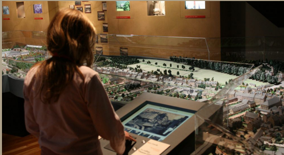
Espace mémoire locale - ©Musée Charles Léandre

Animations : consulter le site internet du musée www.musee-charles-leandre.fr