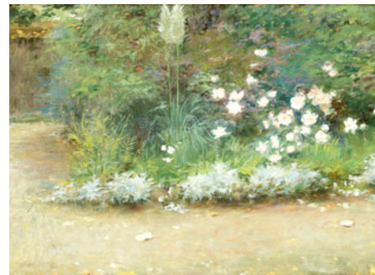
Le parc, huile sur panneau, Coll. musée Charles Léandre

Dans un décor évoquant son atelier montmartrois, le musée de Condé-sur-Noireau offre une découverte de l'univers de l'artiste et met en lumière la diversité de ses inspirations de peintre, portraitiste, caricaturiste, lithographe et sculpteur.