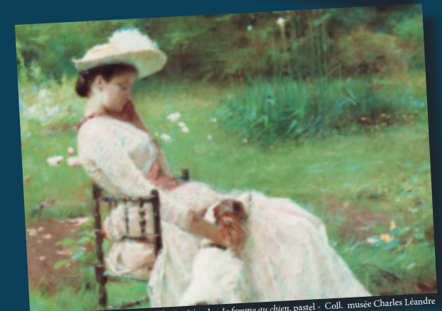
Charles Léandre, la femme au chien, pastel - Coll. musée Charles Léandre