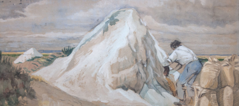
Le Saunier