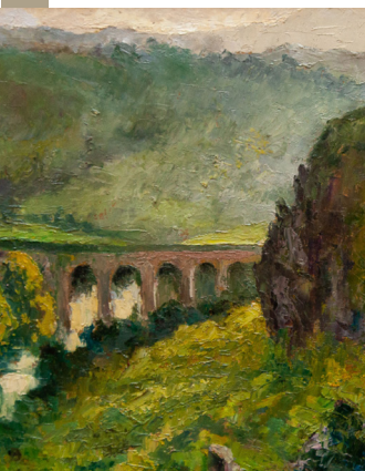
Le viaduc de Clécy.

Né à Flers en 1887, André Hardy entre à quinze ans à l'École normale. Il est nommé instituteur et enseignera longtemps à Clécy, dont les paysages emblématiques se retrouvent très souvent dans ses tableaux. La production artistique d'André Hardy est considérable : peintures à l'huile, généralement de petit format, dessins, gouaches, gravures, quelques sculptures.