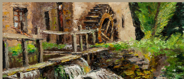
Moulin à eau

Profitez de votre passage au Musée André Hardy pour découvrir un tout nouvel espace dédié au peintre. Objets personnalisés, reproductions d'œuvres, livret de visite et autres souvenirs sur le thème de l'impressionnisme.